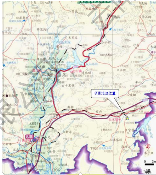
图1 公司地理位置图