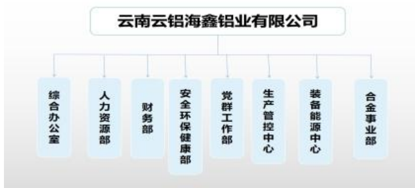
图 1 盘查方组织机构图